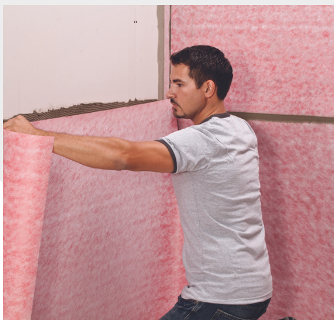
Instalar la membrana para zonas húmedas Aqualay de manera uniforme y dejar secar