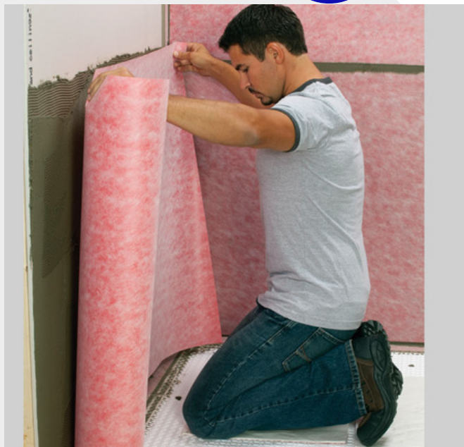
Posicionar la membrana para zonas húmedas Aqualay en la superficie a impermeabilizar