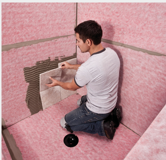
Luego de instalación se procede a instalar el cerámico o porcelanato